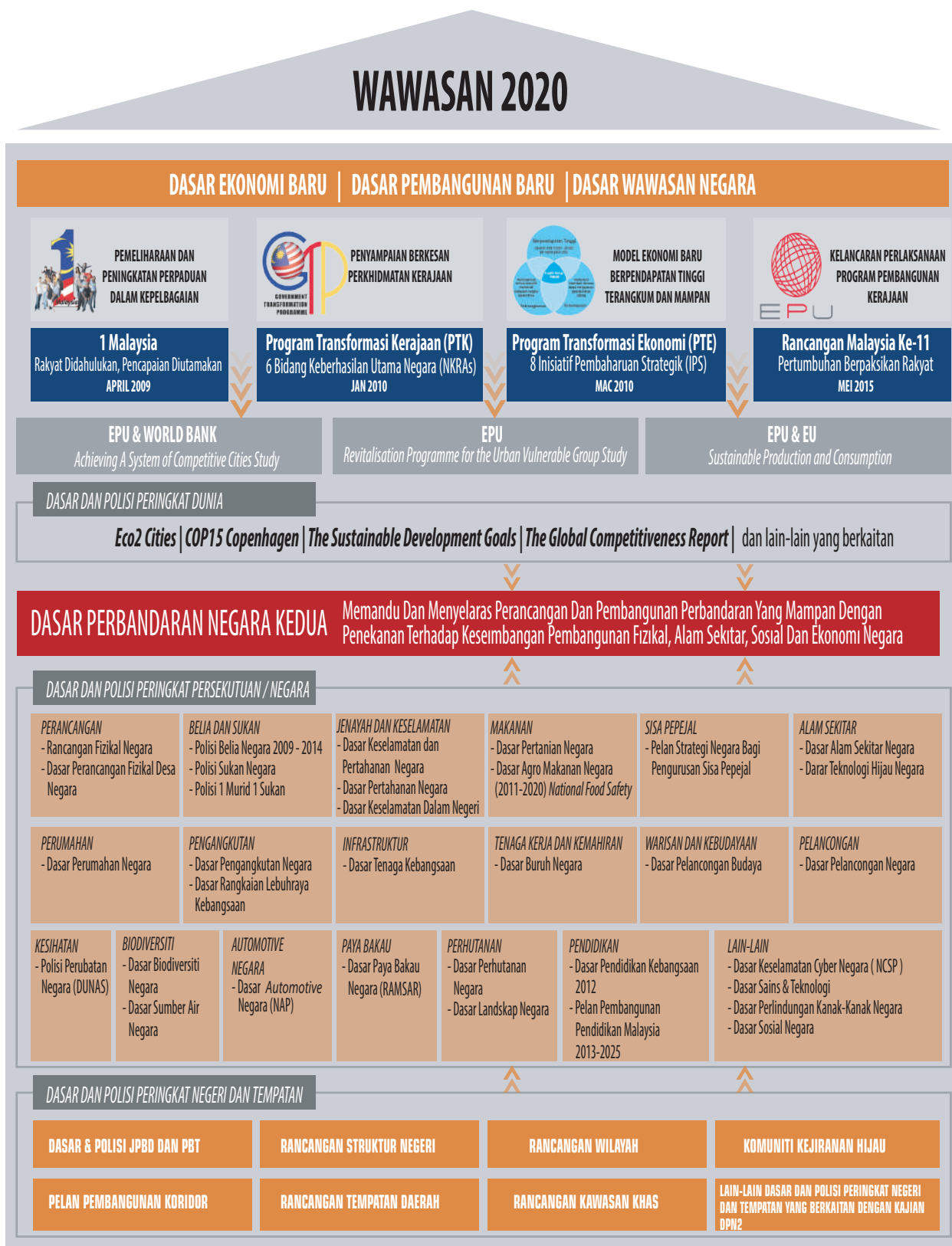
Rajah 3.1: Dasar Dan Polisi Yang Diambilkira Dalam Pembentukan DPN2