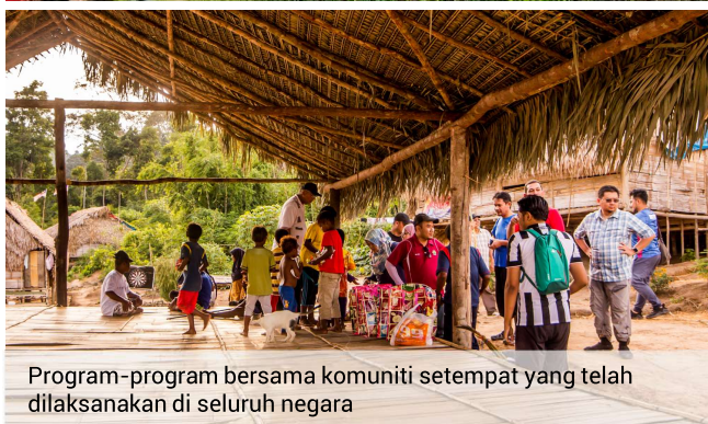
Program-program bersama komuniti setempat yang telah dilaksanakan di seluruh negara