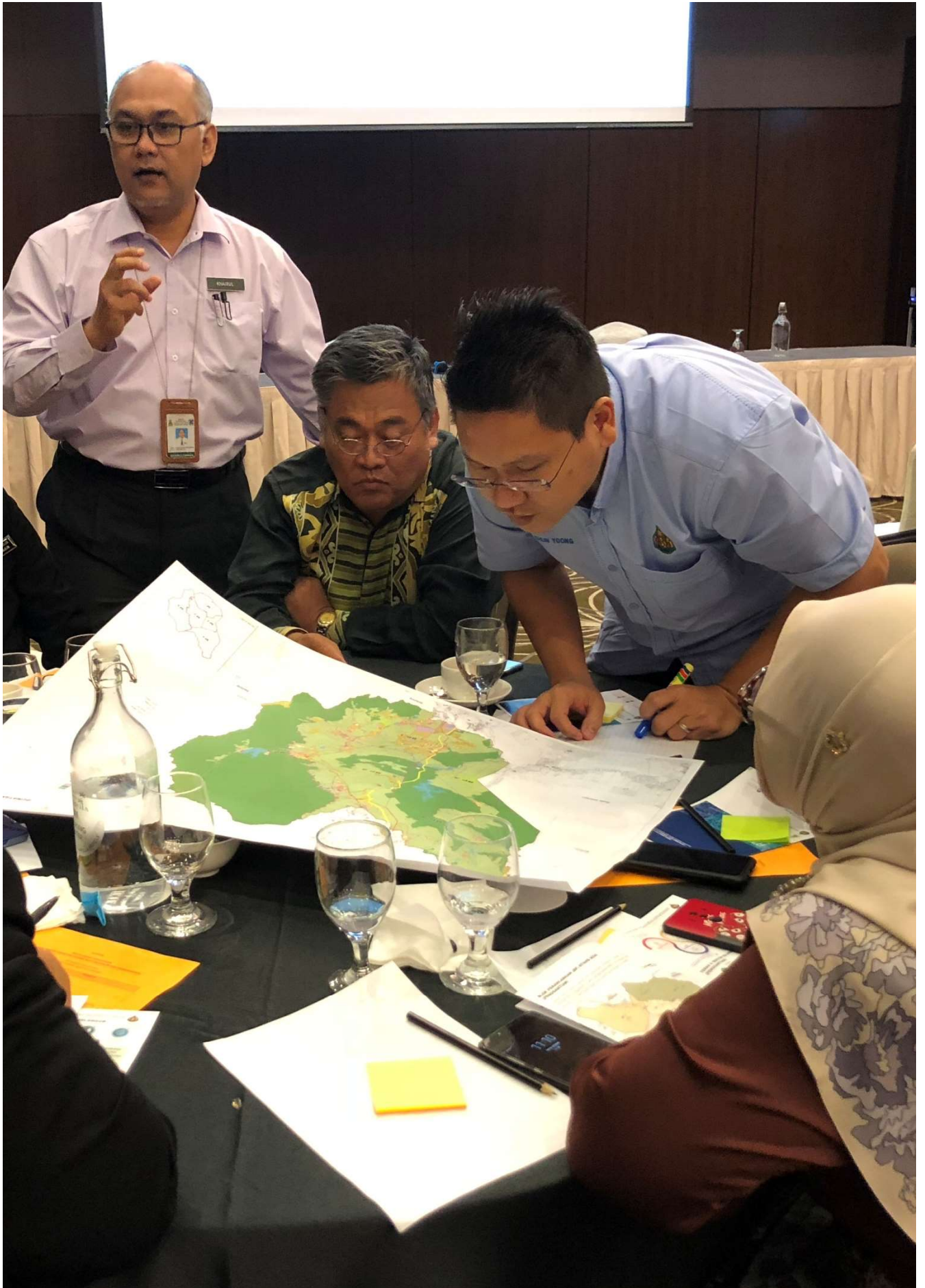
Focus Group Discussion (FGD) Rancangan Tempatan Daerah Hulu Selangor 2035