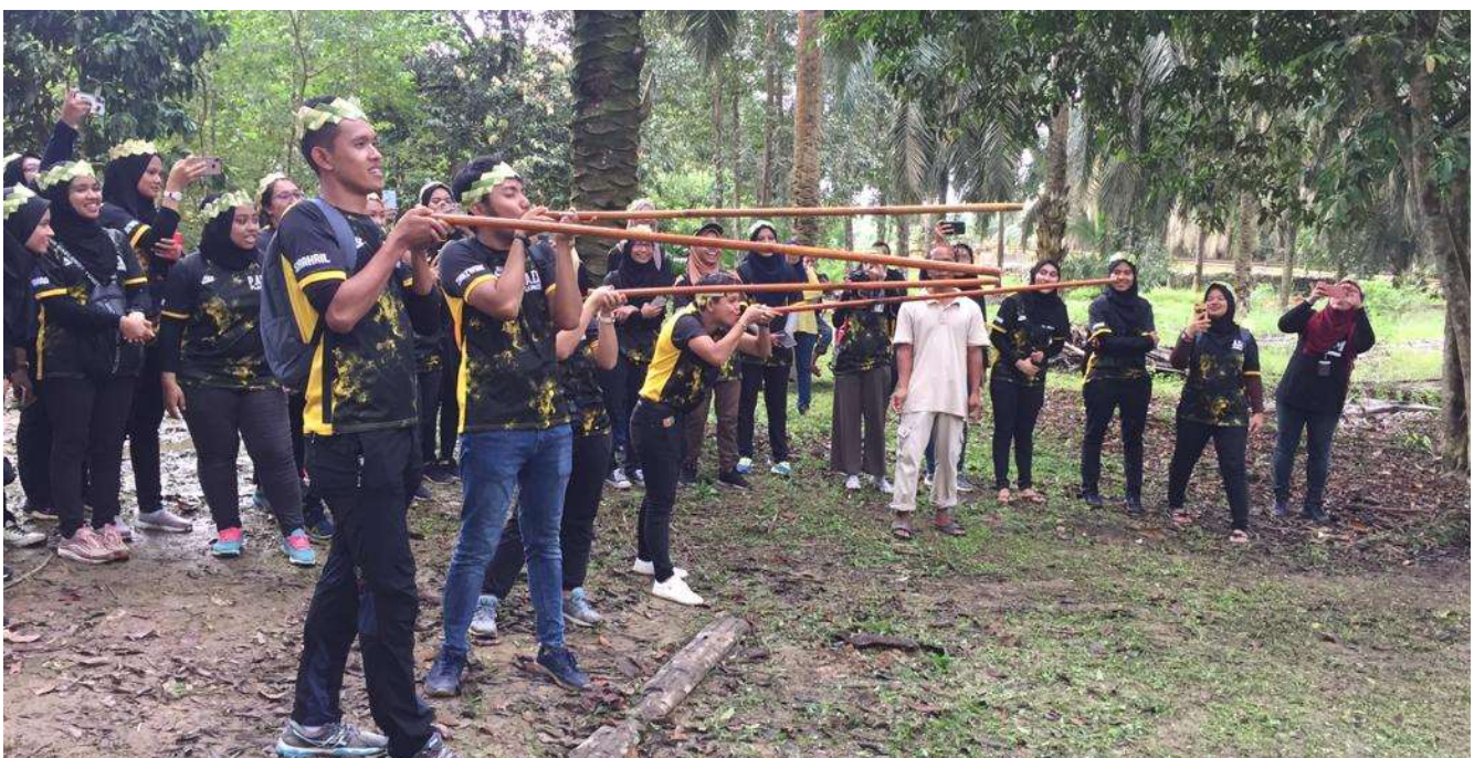
Program Bersama Masyarakat Orang Asli Sg Peroh, Johor

Selain itu, pelbagai pihak berkepentingan terutamanya sektor korporat dan pemain industri dilihat mempunyai peranan tersendiri dalam menyumbang kepada pembangunan ekonomi, sosial dan juga persekitaran negara melalui penerapan kolaborasi dan perkongsian strategik.