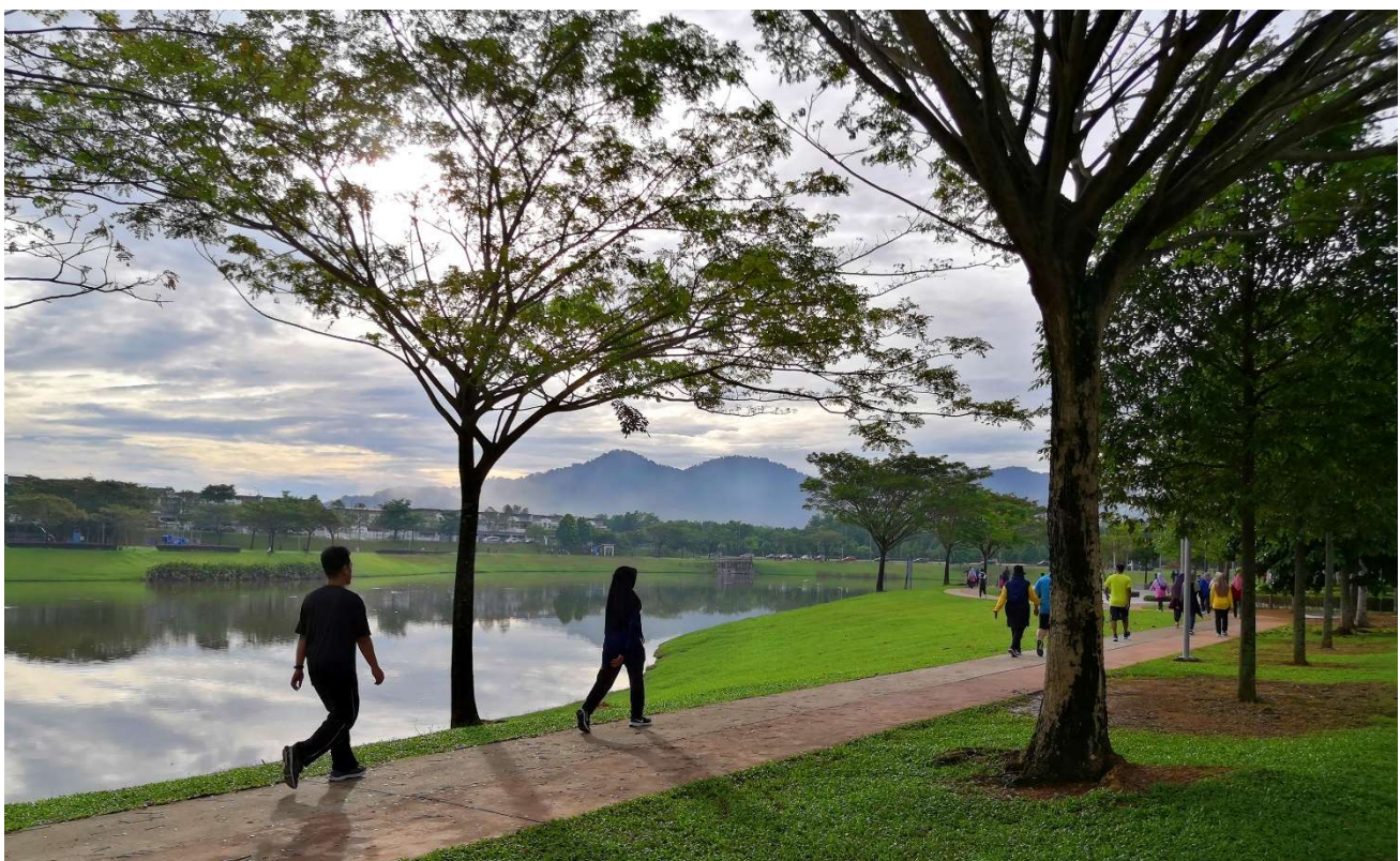
Aktiviti riadah komuniti di taman-taman awam

Hal ini memerlukan galakan dan mobilisasi infrastruktur dan kemudahan ke arah perkhidmatan penjagaan persekitaran yang berkualiti serta menggalakkan kesedaran penduduk terhadap gaya hidup bersih, sihat dan selamat.