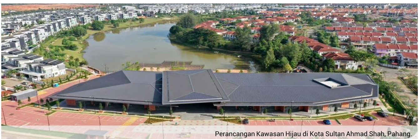
Perancangan Kawasan Hijau di Kota Sultan Ahmad Shah, Pahang.