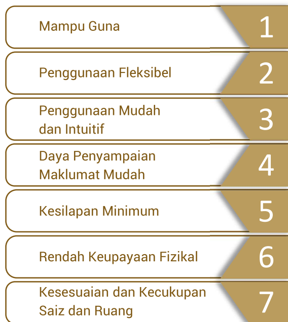
Rajah 6-7: Prinsip-prinsip Reka bentuk Sejagat

Penyediaan kemudahan-kemudahan dan persekitaran bandar berkonsepkan reka bentuk sejagat perlu memenuhi elemen-elemen perancangan seperti mudah sampaian yang tinggi, selamat, selesa dan mesra pengguna.