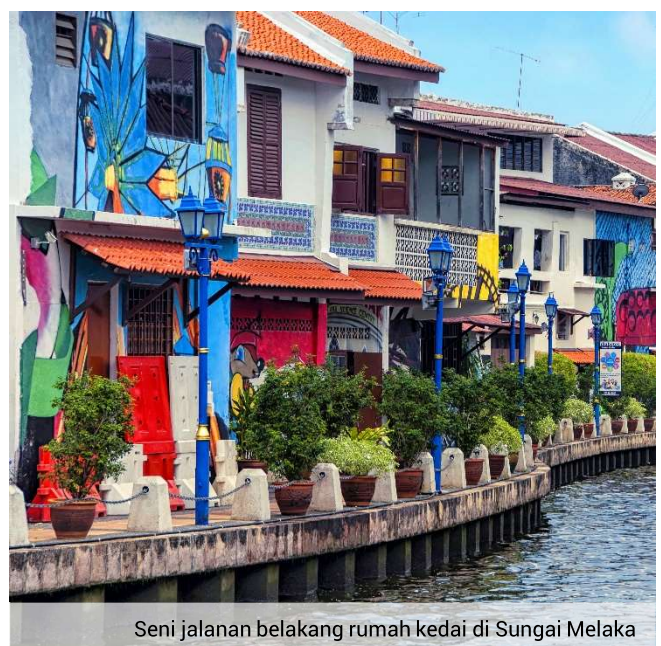
Seni jalanan belakang rumah kedai di Sungai Melaka