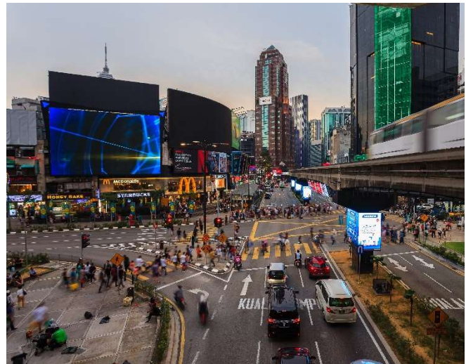
Laluan pejalan kaki di tengah-tengah Bukit Bintang