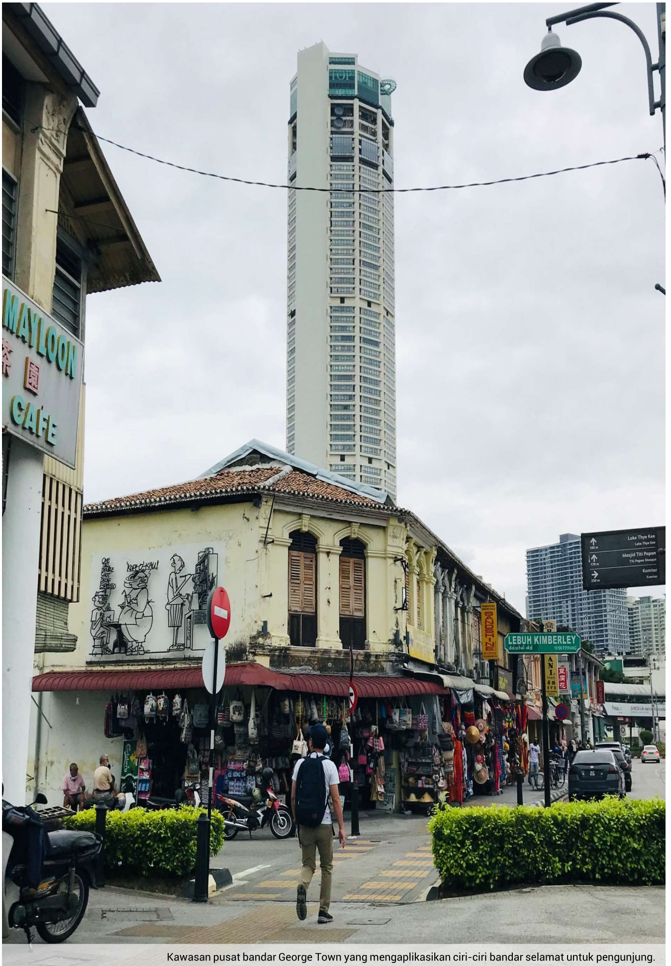
Kawasan pusat bandar George Town yang mengaplikasikan ciri-ciri bandar selamat untuk pengunjung.