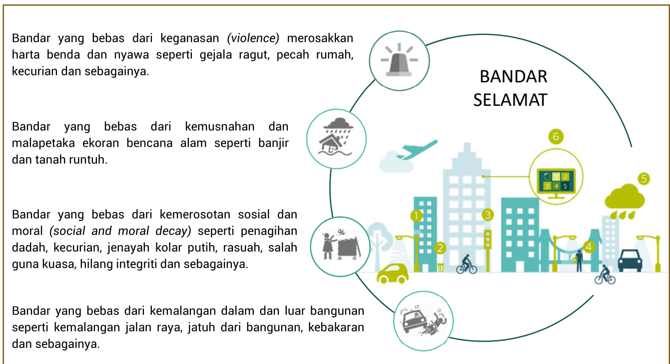
Rajah 6-8: Ciri-ciri Bandar Selamat