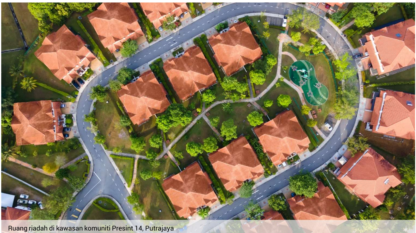
Ruang riadah di kawasan komuniti Presint 14, Putrajaya

Tindakan-tindakan ini memperincikan langkah pelaksanaan dari segi penyediaan ruang kemudahan yang boleh digunakan secara bersama, membangunkan persekitaran yang mudah diakses, dan mengarusperdana amalan gaya hidup bersih, sihat dan selamat dalam kawasan tempat tinggal penduduk terutama di kawasan bandar-bandar utama.