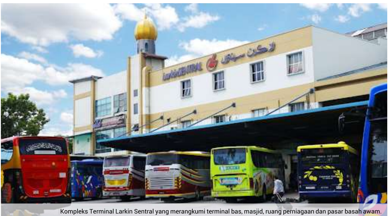
Kompleks Terminal Larkin Sentral yang merangkumi terminal bas, masjid, ruang perniagaan dan pasar basah awam.

Pihak berkepentingan hendaklah merancang dan mereka bentuk kemudahan-kemudahan dan persekitaran bandar yang dapat memenuhi keperluan akses oleh semua golongan individu termasuk kanak-kanak, warga emas dan golongan orang kelainan upaya (OKU). Penyediaan kemudahan masyarakat mampu memberi manfaat serta memenuhi kehendak masyarakat setempat dan mencapai matlamat pembangunan mampan.