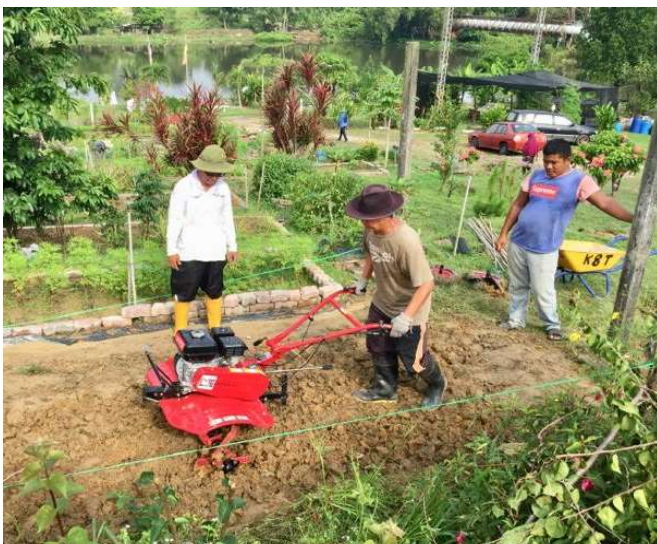
Kebun Komuniti Seksyen 8 Timur Shah Alam, Selangor