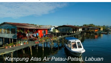
Kampung Atas Air Patau-Patau, Labuan