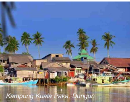
Kampung Kuala Paka, Dungun