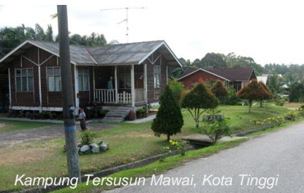
Kampung Tersusun Mawai, Kota Tinggi