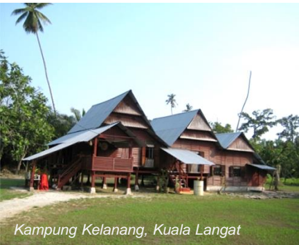
Kampung Kelanang, Kuala Langat