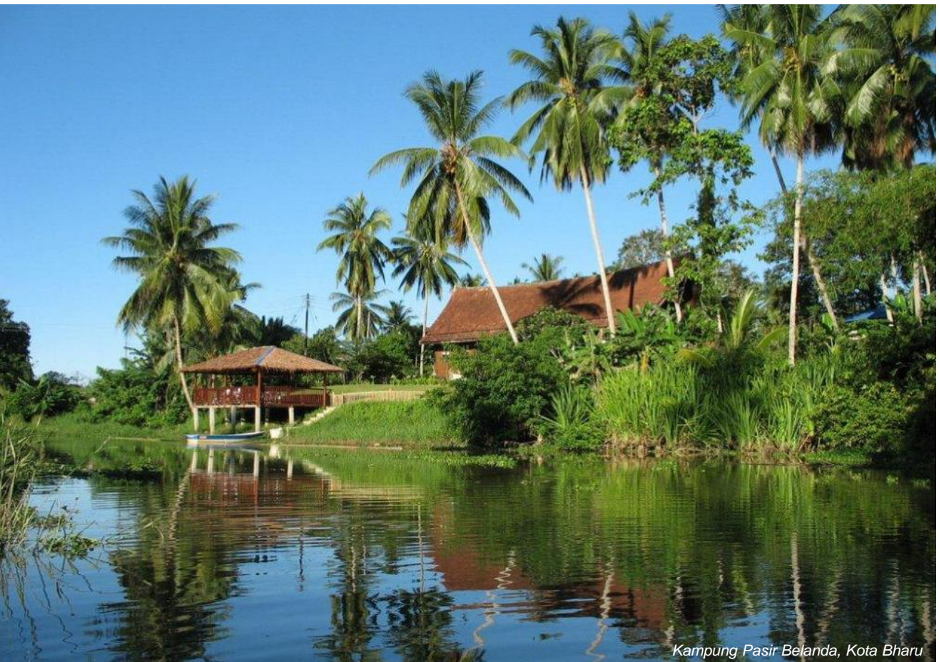
Kampung Pasir Belanda, Kota Bharu